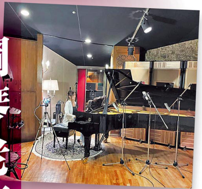
李丹的鋼琴專輯，在殿堂級的錄音室 Avon Recording Studios 現場錄音，不少天王天后包括陳百強、王菲、張國榮及陳奕迅亦曾在此裏錄音。