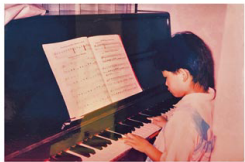
6歲時爺爺送她一部鋼琴，自此每天不停練習。

在一連串的治療過程中，也遇到不少問題。「一個有經驗、能用合適方法教導自閉譜系孩子的老師，肯定費用不菲，而家長卻沒辦法肯定錢是否花得合理。我曾遇上一間感覺合適的機構，查詢時職員似乎很有心，但付了學費後，卻是一大批小朋友一起上課，大多是有社交障礙的，這樣的學習方法並不太適合我的孩子，反而弄巧反拙，學習了一些不禮貌的言行回家。」後來她發現原來當時最需要的是社工。「我在家福會遇到很好的社工，支援媽媽的各方需要，亦會推薦一些合適的課程給我們，對我來說這種支援是最有效用的。」