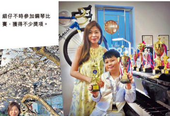
細仔不時參加鋼琴比賽，獲得不少獎項。